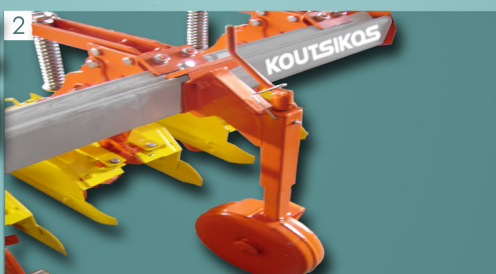
2 Τροχός ρύθμισης βάθους Depth adjustment wheel