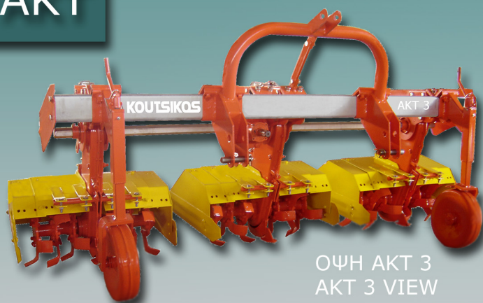
ΟΨΗ ΑΚΤ 3 AKT 3 VIEW