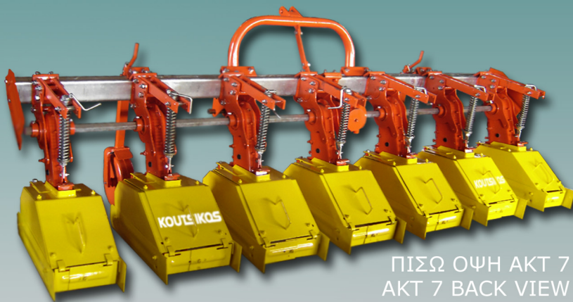
ΠΙΣΩ ΟΨΗ ΑΚΤ 7 AKT 7 BACK VIEW