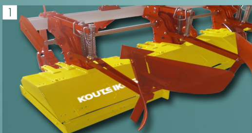
1 Αυλακωτήρας αποσπώμενος Detachable furrowing plate

Adjustable furrowing plates Fertilizer distributor 250 kg capacity Hydraulically folding frame