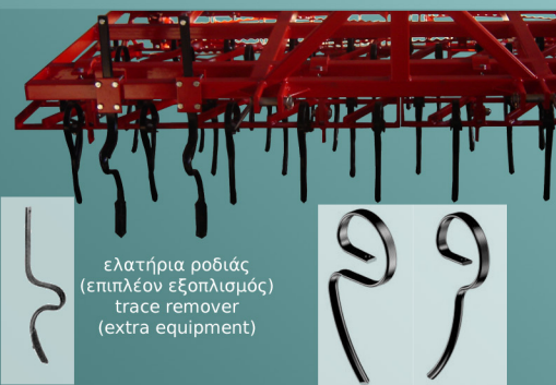
ελατήρια ροδιάς (επιπλέον εξοπλισμός) trace remover (extra equipment)