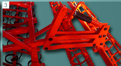
3 Μηχανική ρύθμιση κυλίνδρων με ανάρτηση Mec. adjustment of rollers with suspension