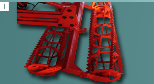
1 Διπλοί ανεξάρτητοι κύλινδροι Double independent rollers

KOUTSIKOS seedbed cultivator is used for the soil preparation before seeding at all agricultural activities. The high productive modern cultivator with low maintenance costs is characterised by its reliability and the excellent work in high speed. Using the CSS cultivator we succeed fuel and time save because tilling, leveling and finishing is achieved in a single pass. It is a fully mounted seedbed cultivator and all the parts are easily interchangeable as they are connected by bolts. When a part is broken down only that part has to be replaced keeping the costs during the use in low levels. The seedbed cultivator has 2 independent frames and is equipped with vibrating tines that have a perfect output under an intensive workout at the adjusted working depth. So the natural structure of the soil is preserved. The frame and the 3 point hitch attachment are rigid and reinforced. For the models with larger working width the frame is folding by double acting hydraulic cylinders for a safer road transport. Finally, CSS seedbed cultivator is equipped by independent and removable double rollers with mechanical depth regulation. It could be equipped with leveling blade & trace remover (extra equipment).