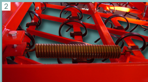
2 Ελατήριο πλαισίου Frame spring