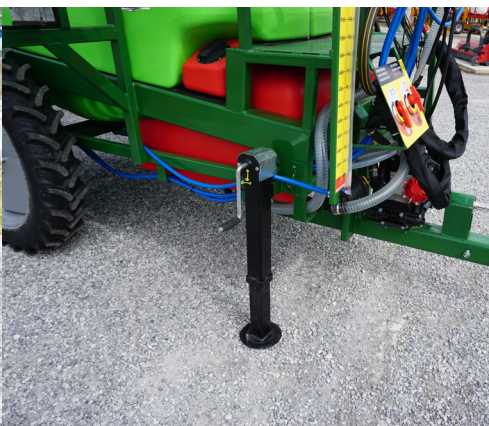
Cric de parcare