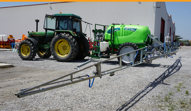
Aripi solide si stabile