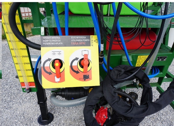
Ușurință prin robinete cu bilă