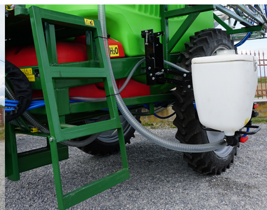
mixer instalat pe un suport paralelogram