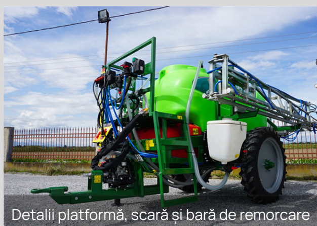
Detalii platformă, scară și bară de remorcare