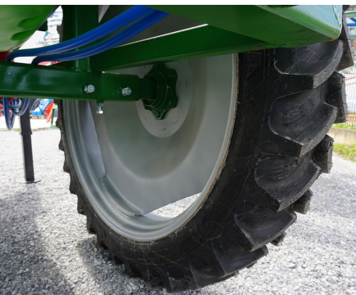
Lățimea ecartamentului variabilă &amp; opțiuni de anvelope

Ecartamentul variabil al axei este astfel conceput pentru a putea fi utilizat la diferite tipuri de culturi. Există multiple opțiuni în ceea ce privește diametrul și lățimea roților cu care poate fi echipat erbicidatorul JET T fiind adaptabil la culturi cu diferite caracteristici.