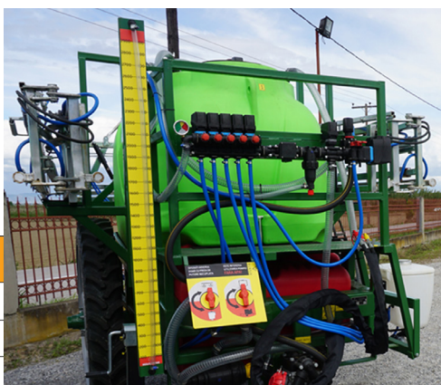
Indicatorul de nivel este clar vizibil