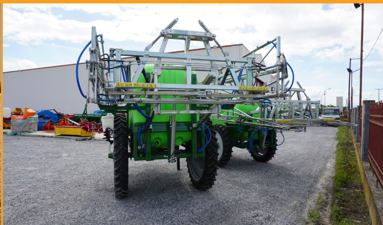
Arcuri și amortizoare asigură stabilitatea